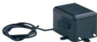
M 2069. Dosificador anticalcáreo 220 v.