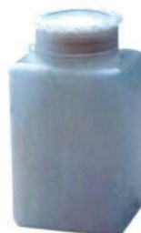
M 2070. Depósito 2 lts. anticalcáreo