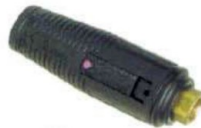
M 2015 Variojet

Kit rep. M 2085.13 - M 2085.15 - M 2085.17