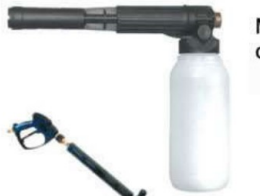
M 2012 Lanza espuma profesional con depósito 2 lts.