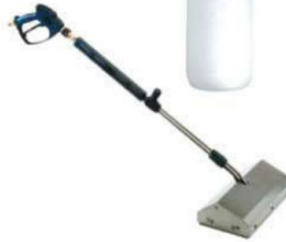
M 2013 Lanza lavasuelos Ace-inox. Anchura 400 mm.