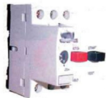
L 9001. Interruptor térmico 10-16.