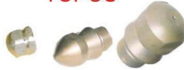
M2019 Microdrain. H 1/8". 100 bar. 8-11 l/m.