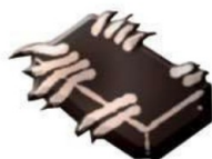
P 1023. Bloque temporización máquina y caldera.