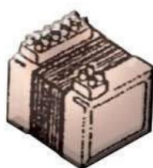
P 1026. Transformador 220-380 a 24 v.