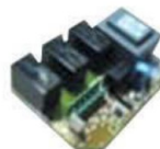
P 1063. Ficha TSI agua fría.