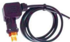
P 1027. Prensostato 220 v. 250 bar. Rosca 1/4".