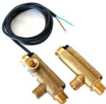
M 2068. Flusostato.